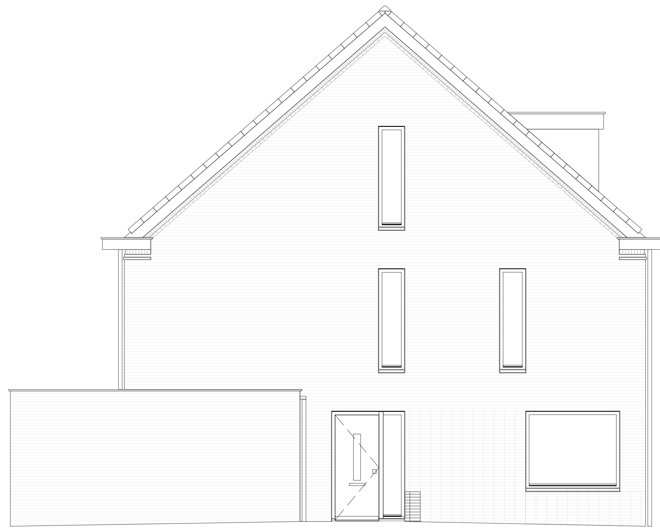
zijgevel schaal 1:50